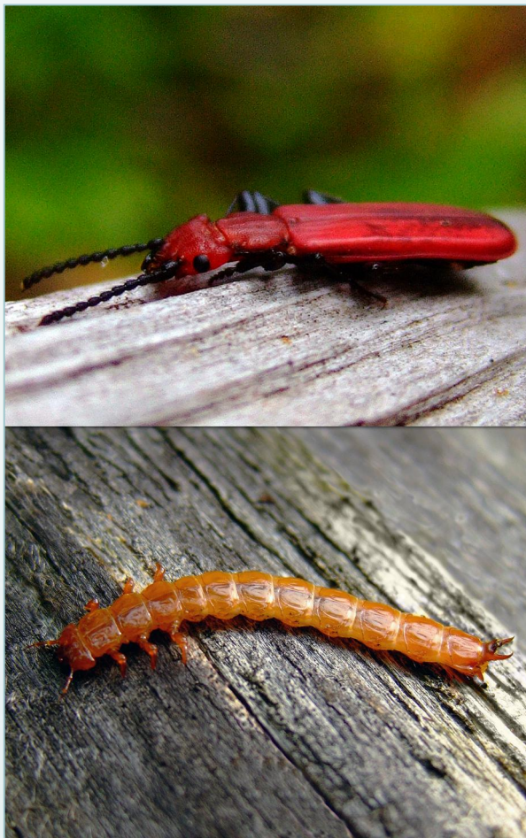
Voksen bille (øverst) og larve (nederst) av sinoberbille. Merk den flate kroppsformen!

puppekammer som ofte er kledd med løse barkstrimler. Den voksne billen klekker etter to-fire uker, forlater puppekammeret og overvintrer under bark eller i vedsprekker. Sinoberbille er altetende (bark, sopp og smådyr). Siden larvene bare lever i nylig døde trær (hovedsakelig to til tre år etter treet død), kan sinoberbille sannsynligvis kun gjennomføre én generasjon i et gitt tre. Arten er derfor avhengig av skog med relativt høy tetthet av osp, slik at det stadig dannes nye levesteder i form av nylig død osp.